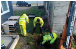
Réparation descente d'eaux à l'école du Centre