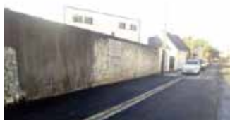
Remise en état de la chaussée suite aux voitures incendiées