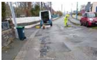
Rebouchage nids de poule rue Joachim Uhel